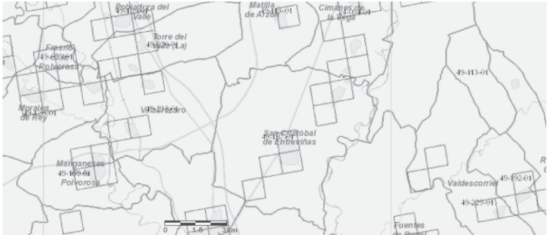
Figura 3. Consulta de información mediante "grid"