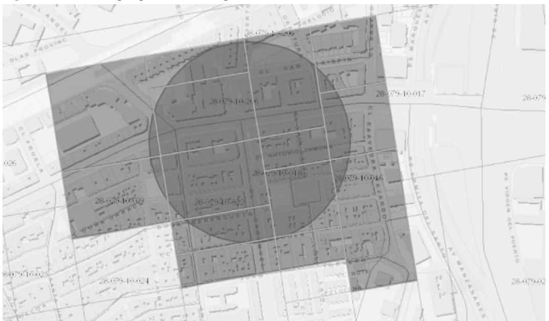
Figura 4. Selección geográfica sobre "grid"