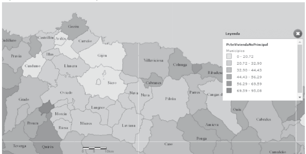
Figura 1. Visualización de mapas temáticos